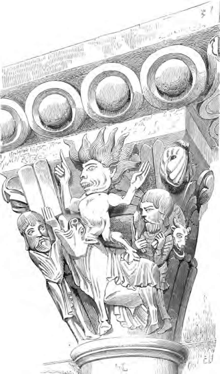
Figura 7. Viollet-le-Duc, capitello all'interno della chiesa di Sainte-Madaléine a Vezelay (da VIOLLET-LE-DUC 1854-1868, v. 2, 1854, p. 489).