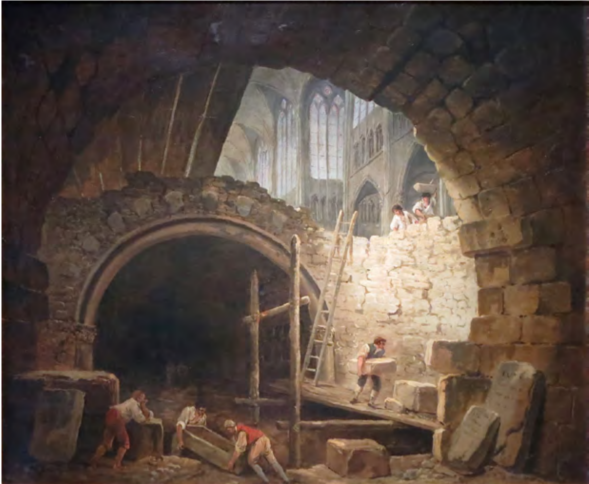
Figura 1. Hubert Robert, Violation des caveaux royaux de Saint-Denis en Octobre 1793 , XVIII secolo, Musée Carnavalet, Paris, https://fr.wikipedia.org/wiki/Profanation_des_tombes_de_la_basilique_Saint-Denis#/media/File:HubertRobertViolationDesCaveauxASaintDenis.JPG (ultimo accesso 14 gennaio 2017).