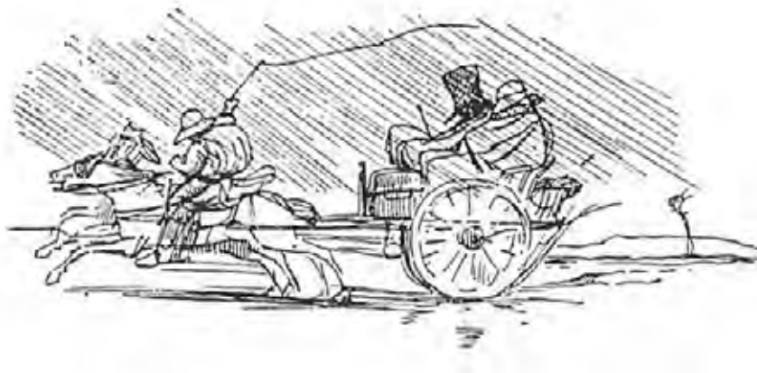
Figura 6. Viollet-le-Duc, l'inspection des monuments historiques , 1842 (da LÉON 1951, p. 198).

Vi è poi il ruolo fondamentale dell'architetto 43 : il progettista ideale, incarnato da Villard de Honnecourt, corrisponde a un intellettuale che riunisce varie competenze, un po' musicista un po' medico, vale a dire, un po' artista, un po' scienziato (fig. 5). Facendo parlare un redivivo Villard, Viollet spiega le virtù dei costruttori medievali, lontani per formazione dall'architetto che a quei tempi acquisiva il titolo presso l'Ecole des Beaux Arts: essi erano allo stesso tempo architetti e ingegneri, competenti sui materiali e sul modo più appropriato per utilizzarli, capaci di progettare le decorazioni e variarle all'infinito. Erano inoltre in grado di dialogare con l'esigente committenza, sia privata che religiosa, e di gestire il cantiere e gli operai che in esso erano impiegati, controllando i prezzi e indirizzando le maestranze nell'uso di macchinari e attrezzature 44 . Descrivendo le competenze dell'architetto medievale egli di fatto tratteggia se stesso ma, più in generale, il tecnico del Service des monuments historiques. Un figura poco conosciuta, per nulla valorizzata e mal pagata, molto