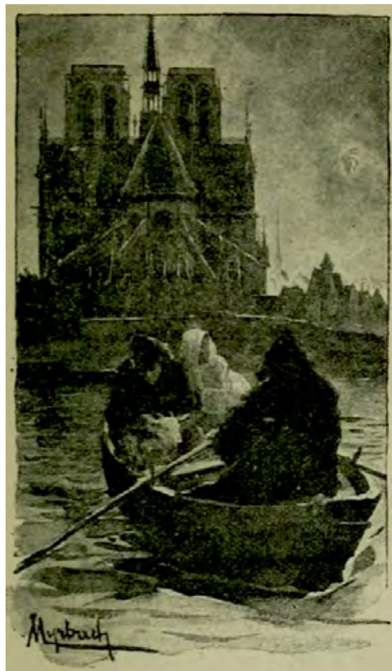
Figura 4. Gustave Brion, frontespizio per Notre-Dame de Paris , 1865 ca. (V. HUGO, Notre-Dame de Paris , illustrée de soixante-dix dessins par Brion, J. Hetzel et E. Lacroix éditeurs, Paris 1865. www.archive.org ); figura 5. Felician Freiherr von Myrbach-Rheinfeld, illustrazione per Notre-Dame de Paris , 1900 ca. (da V. HUGO, Notre-Dame de Paris , Compositions de Belier, Myrbach et Rossi gravées par Ch. Guillaume, 2 vv., C. Marpon et E. Flammarion, Paris 1900, p.309. www.archive.org ).