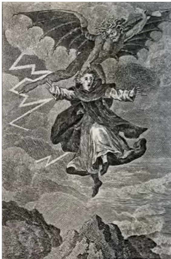
Figure 2-3. Frontespizi dei tomi 1 e 4 del romanzo Il Monaco (da M.G. LEWIS, Le Moine , traduit de l'anglais, Maradan, 1811 en 4 tomes, Bath 1796. www.archive.org ).