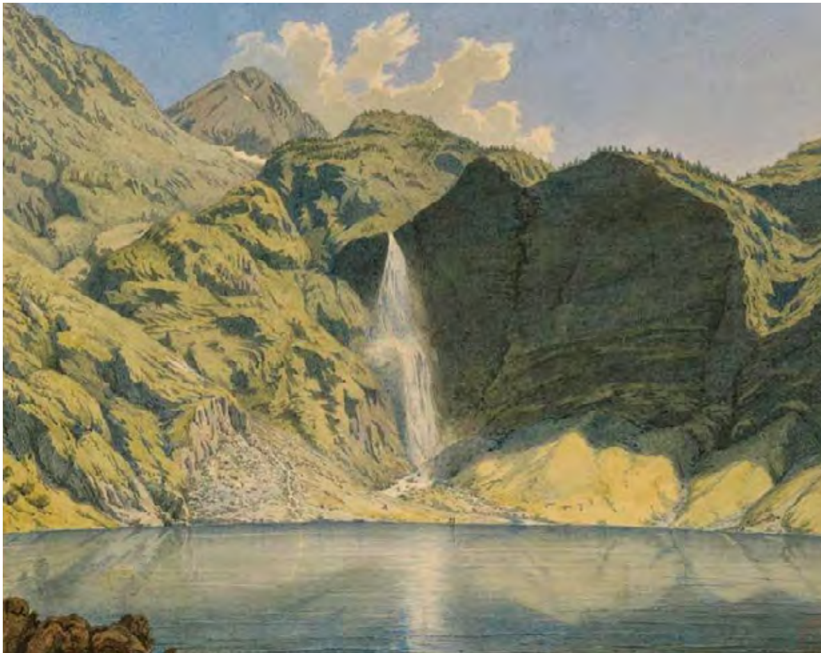
Figura 2. Viollet-le-Duc, Le lac de Séculéjo et la cascade , 1833, Charenton-le-Pont, Médiathèque de l'Architecture et du Patrimoine, http://art.rmngp.fr/fr/library/artworks/eugene-emmanuel-viollet-le-duc_le-lac-de-seculejo-et-la-cascade_aquerelle_1833 (ultimo accesso 14 gennaio 2017).