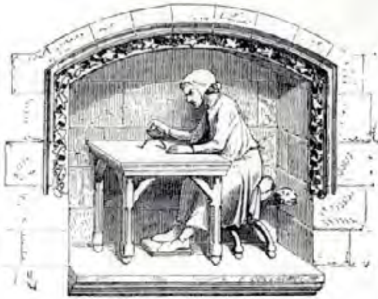
Figura 5. Viollet-le-Duc, particolare del frontespizio del primo volume degli Entretiens sur l'architecture (VIOUET-LE-DUC 1863).

costituiscono il linguaggio sincero, mentre declinano quando si allontanano dalla vita per formare quasi uno Stato a parte, quando diventano una sorta di cultura privata» 39 . In tal senso la lezione di Viollet è attuale: l'architetto, dunque l'architettura, sia adeguata alla civiltà che ne deve fruire; è la mancanza di conoscenza da parte del pubblico che rende quest'ultimo indifferente all'architettura e che, pertanto, inibisce la nascita di linguaggi architettonici contemporanei: «il pubblico [...] che non ha tradizioni per giudicare resta neutrale» pertanto, «l'indulgenza e l'indifferenza del pubblico in materia di architettura sono le ragioni per cui non possiamo averne una che ci appartenga» 40 . In più, senza una nuova architettura non può esistere una teoria dell'architettura (come dare una teoria di un'arte che non esiste? 41 ) per cui rimane insoddisfatto il crescente bisogno di “sapere” e “vedere” («de ce besoin de voir et de savoir» 42 ). Insomma, intrappolata in un circolo vizioso, l'arte del costruire cerca una strada per il cambiamento, ma non può trovarla perché fuori da quel rassicurante (quanto frustrante) recinto della Scuola, nessuno è in grado di comprendere gli idiomi con cui si esprime e non ha interesse, dunque, a sbloccare la serratura per liberarla. È appena il caso di ricordare quanto sia attuale e problematico anche oggi, nel campo dell'architettura e del restauro, il tema della comunicazione.