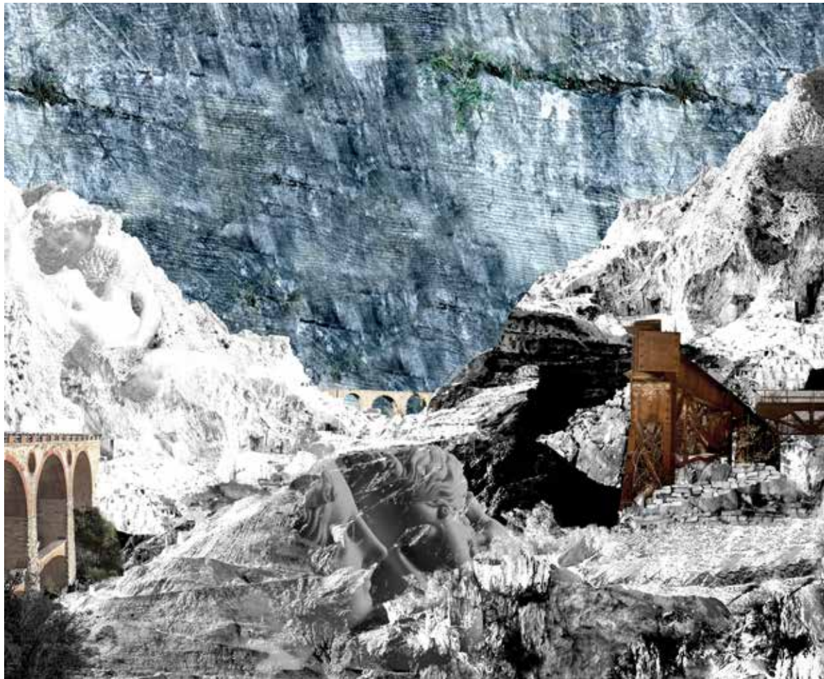
Figura 5. Rappresentazione sinottica-interpretativa del patrimonio del paesaggio di Carrara per la definizione di valori (elaborazione grafica di S. Tonello, 2022).