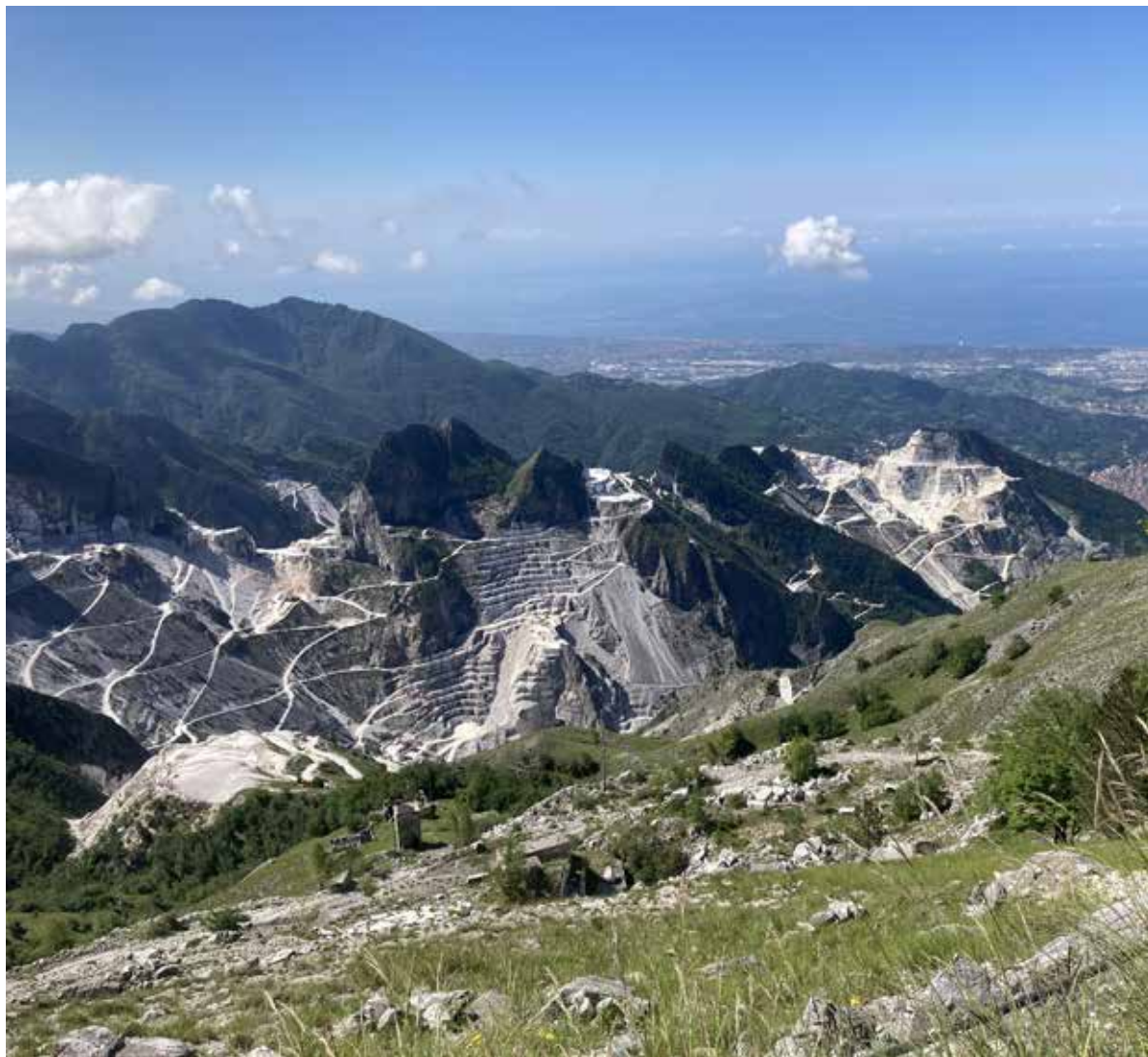
Figura 1. Il bacino estrattivo delle Cave di Carrara visto dalla Foce Pianza (foto: Sofia Tonello, 2022).