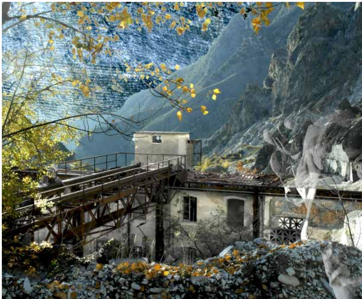
Figura 4. Rappresentazione sinottica-interpretativa del patrimonio del paesaggio di Carrara per la definizione di valori. (elaborazione grafica di S. Tonello, 2022).