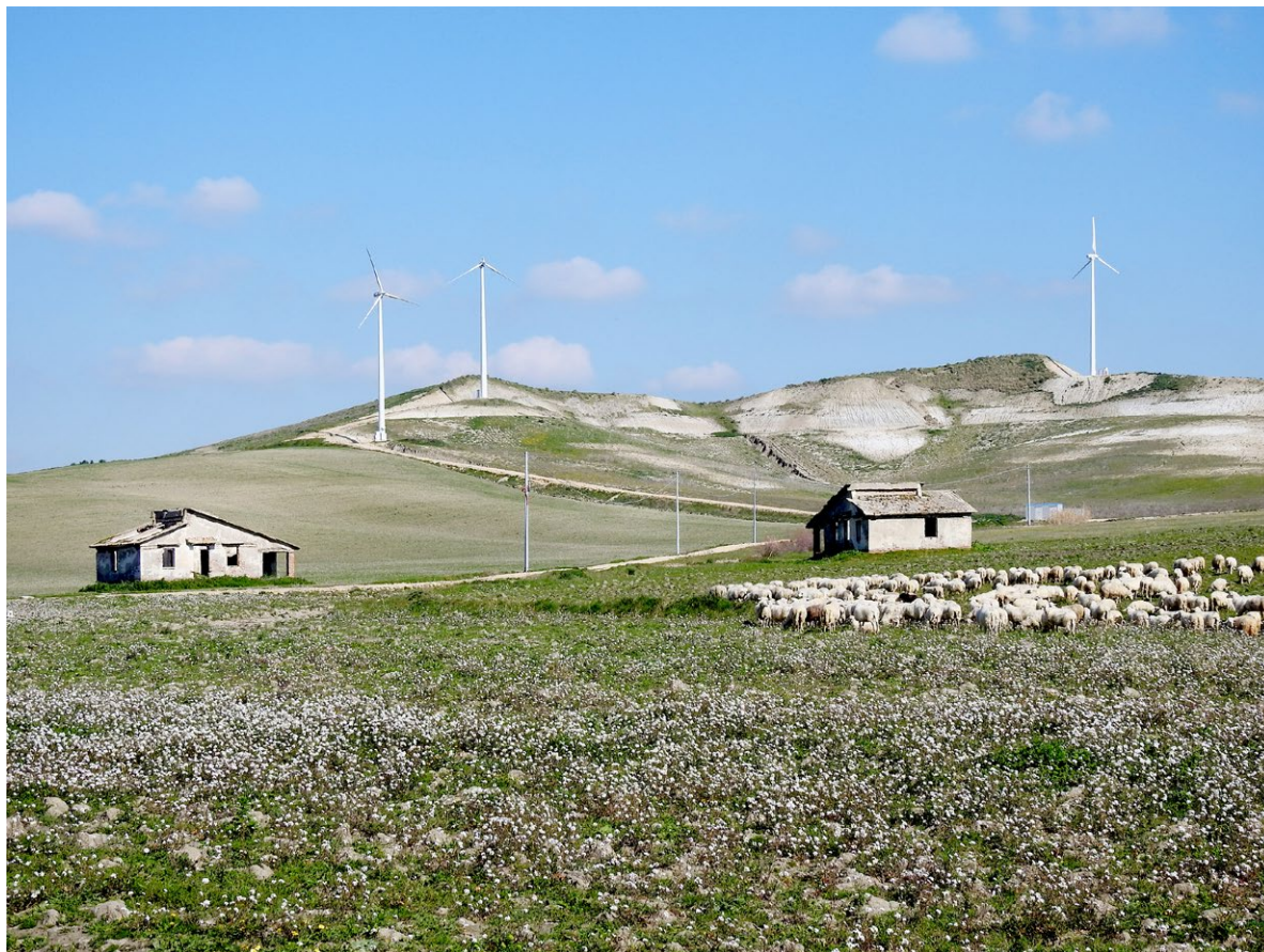
Figura 7. San Leonardo di Cutro, frazione di Cutro (Kr), i segni dell'abbandono del paesaggio agrario e delle case rurali.