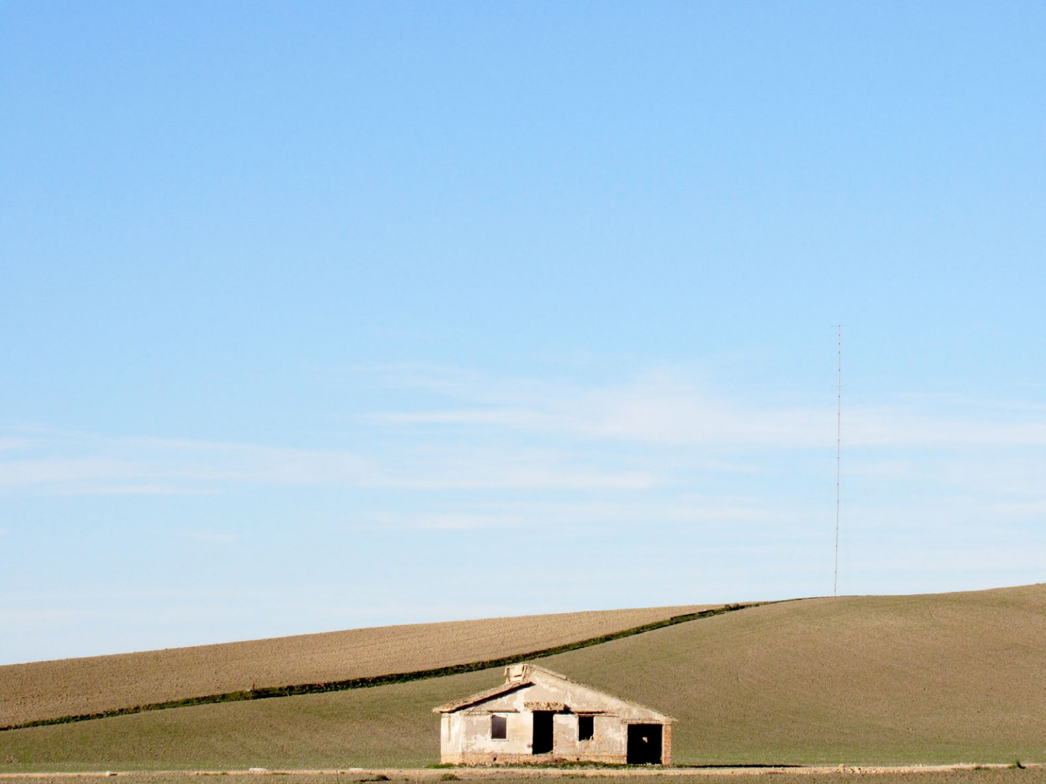
Figura 8. San Leonardo di Cutro, frazione di Cutro (Kr), i segni dell'abbandono del paesaggio agrario (foto F. Scarpino, 2019).