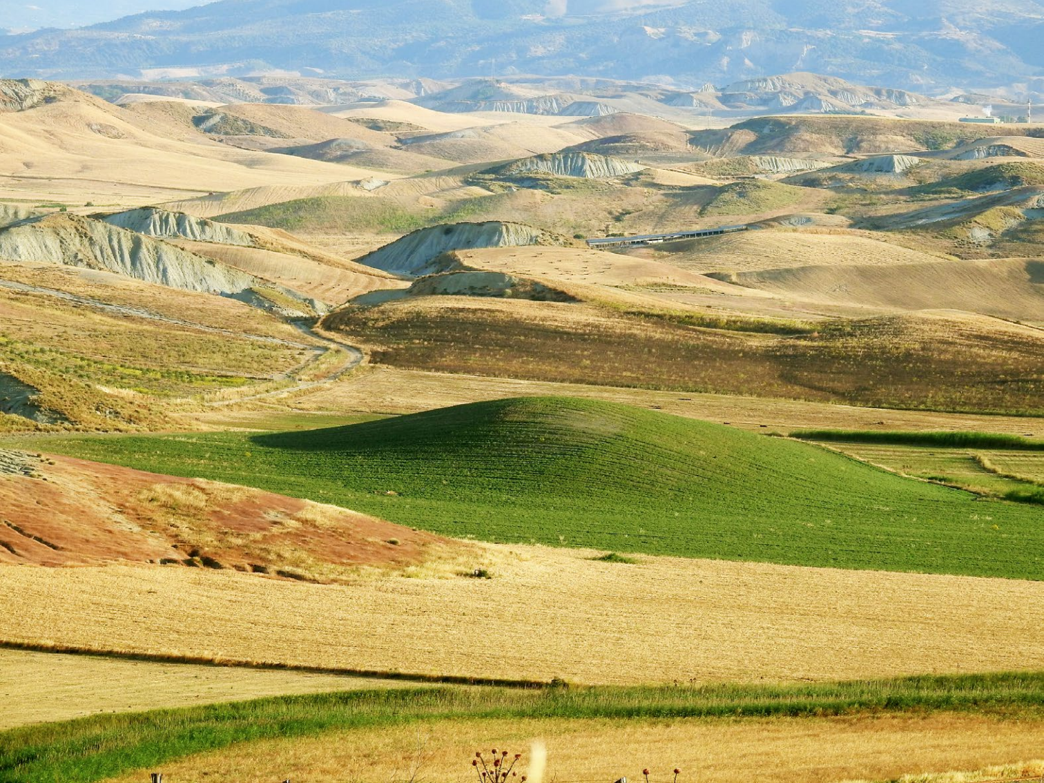
Figura 1. Il paesaggio del Marchesato di Crotona.