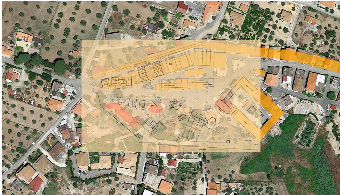
Figura 6. Sovrapposizione tra lo stato attuale e il progetto di Astengo. L'edilizia residenziale (in giallo) non ha subito particolari cambiamenti. Tra gli edifici pubblici (in rosso) solo la chiesa ha mantenuto la sua posizione originaria, invece la farmacia e l'attuale museo della Cultura Contadina sono stati realizzati seguendo in parte le direttive dell'architetto, oggi risultano traslati rispetto alla collocazione stabilita.

quale doveva garantire un'articolazione spaziale e una varietà espressiva di tutti gli edifici (la chiesa, gli alloggi, la scuola, l'ambulatorio e la farmacia, botteghe e mercato coperto e gli altri uffici). Questi, inoltre, rispondevano alle caratteristiche fondamentali da lui stesso definite: essenzialità funzionale e costruttiva ed economicità.