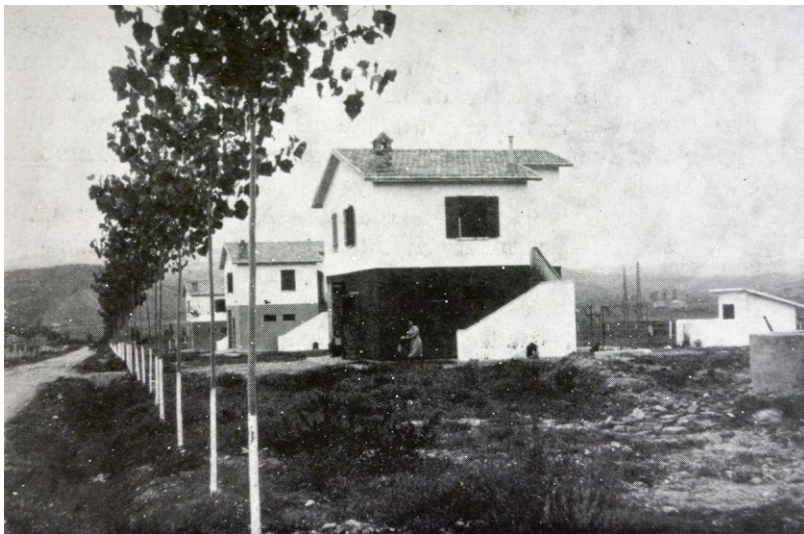
In alto, figura 2a-b. Il sistema insediativo di tipo sparso nella zona collinare e in quella pianeggiante del Marchesato di Crotona, anni Cinquanta; a sinistra, figura 3. La casa rurale di tipo "Cassano" nel Marchesato di Crotona, anni Cinquanta (da ROGLIANO 1962, pp. 45, 47).