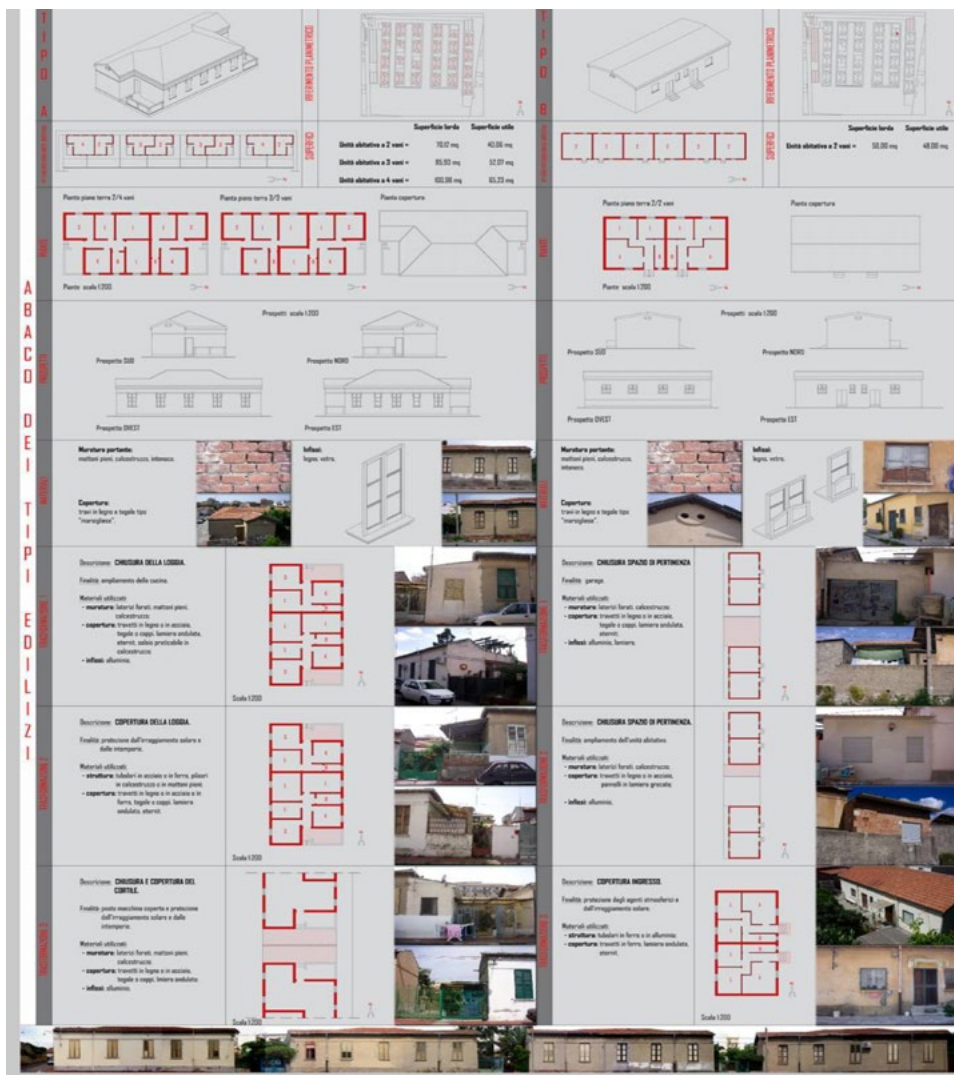
Figura 3. Borgata Giardini: qualità morfologiche, materiche, strutturali e tecnologiche della preesistenza.