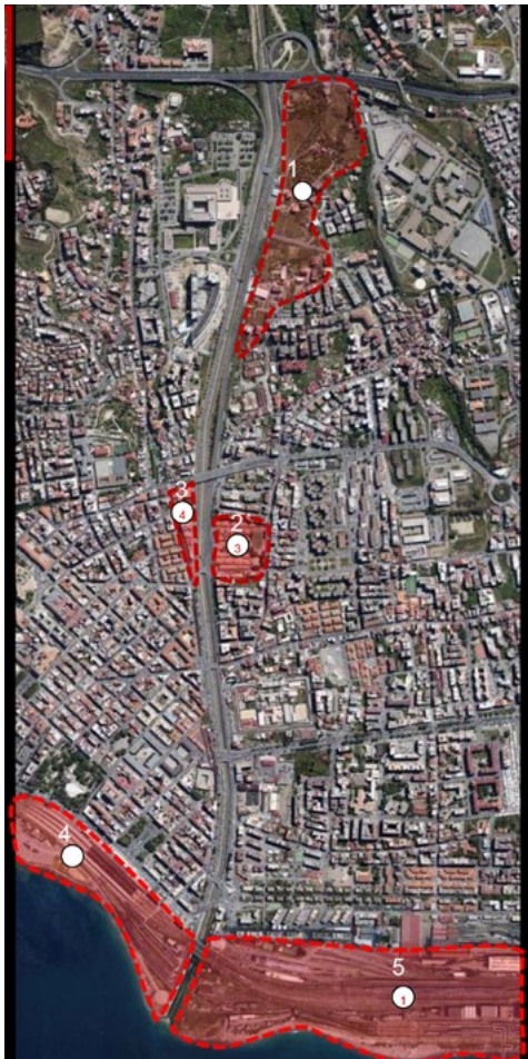
Figura 1. Individuazione aree di intervento lungo la fiumara Calopinace a Reggio Calabria (elaborazione a cura di G. Foti).

di un quadro organico di maglie stradali e percorsi pedonali; dalla progressiva erosione di vaste aree lungo la costa, dalla denaturalizzazione dei contesti antropizzati e naturali; dalla esplosione di edificazioni non controllate. Si sono indagati anche i rapporti che corrono tra il luogo, l'edificio e i suoi componenti; gli equilibri che ne determinano la corretta conduzione delle fasi operative, e