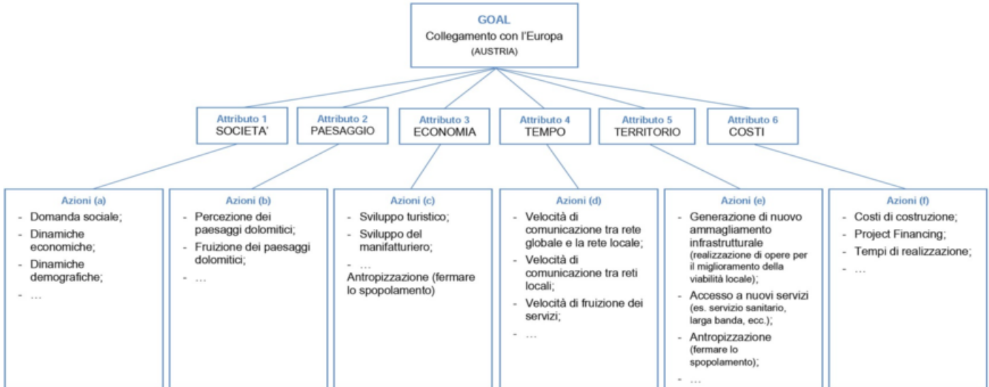
Fig. 2 - Diagramma del metodo di valutazione